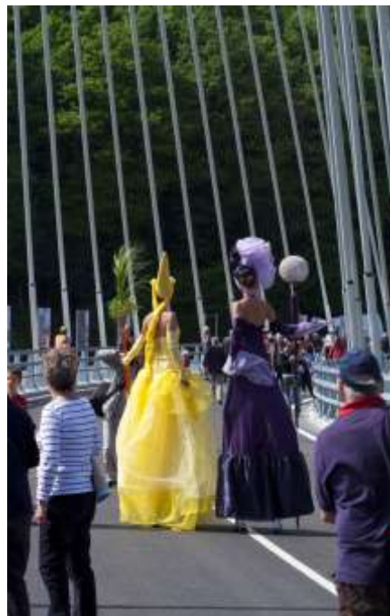
Inauguration du pont de Terenez